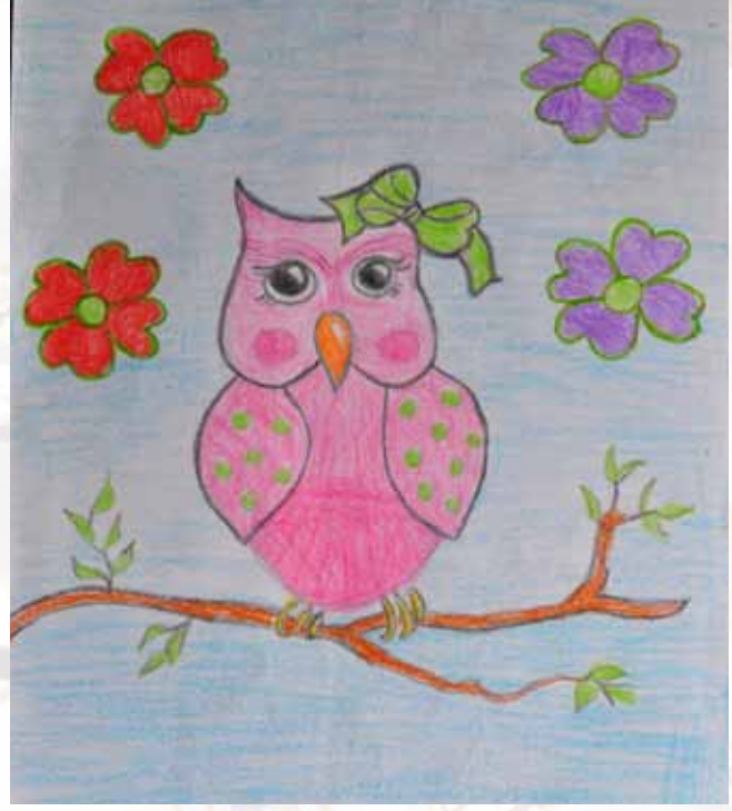
Drawing by Serah Jomon