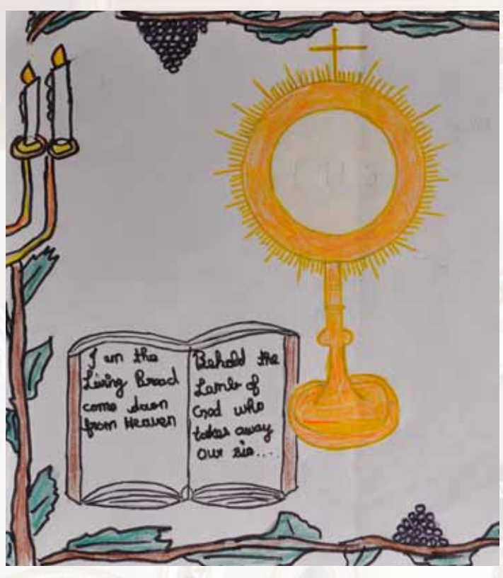
Drawing by Milan K Antony