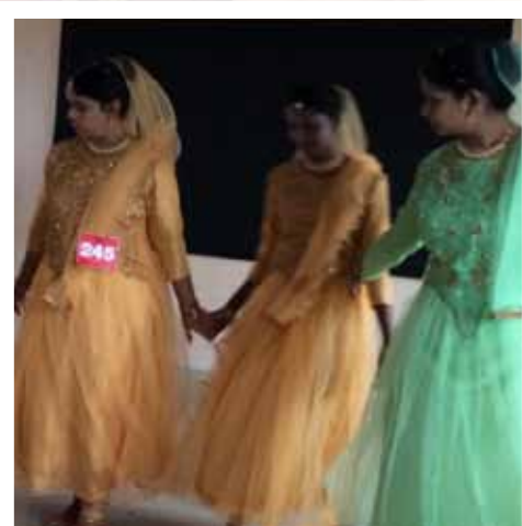
MATHRUJYOTHIS KALOLSAVAM 2018