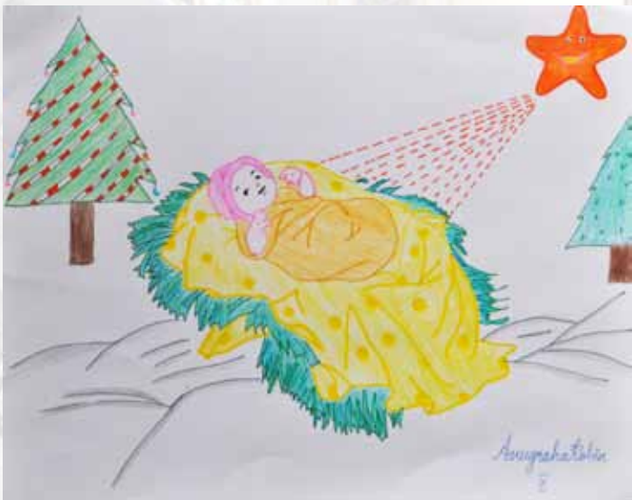
Drawing by Anugraha Robin