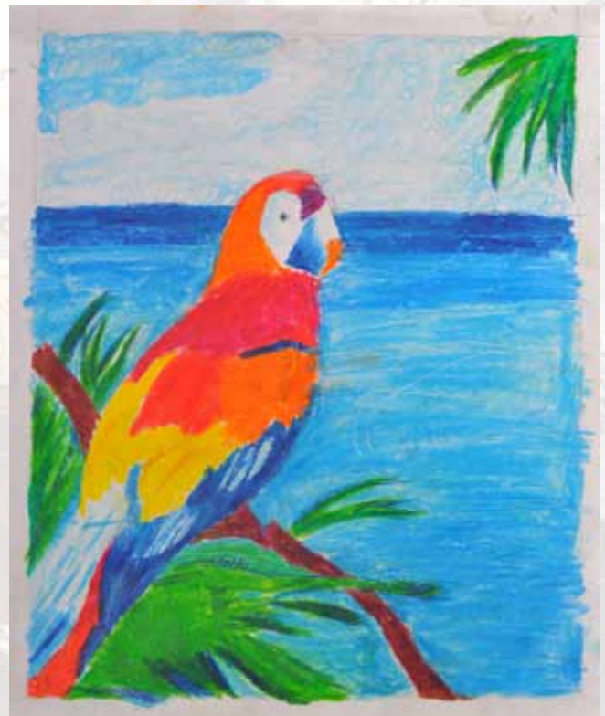
Drawing by Ryan Mathew Tijo